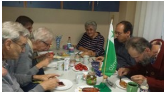
Abbildung 4: Kursanoj dum manĝado