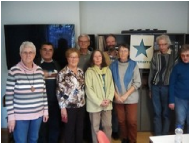
Abbildung 3: Kursanoj