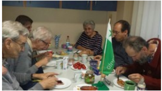
Abbildung 4: Kursanoj dum manĝado