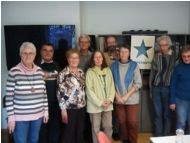
Abbildung 3: Kursanoj