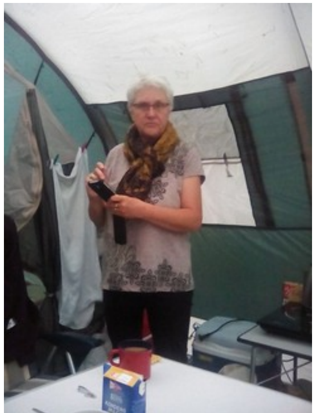
Abbildung 4: Brunjo