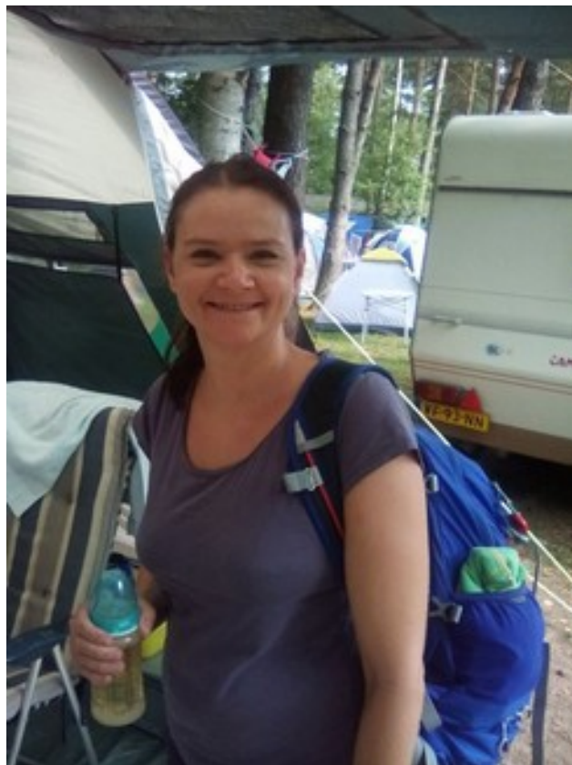
Abbildung 10: Uta ĝuas SEFTon