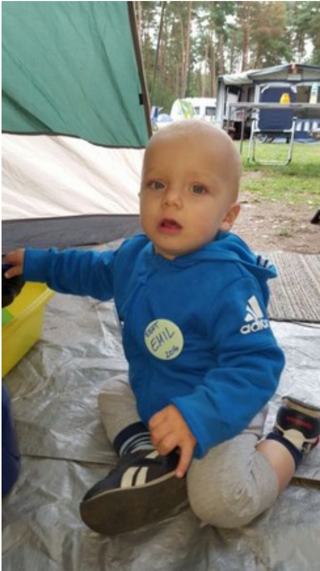
Abbildung 19: Emil ludas dum SEFT