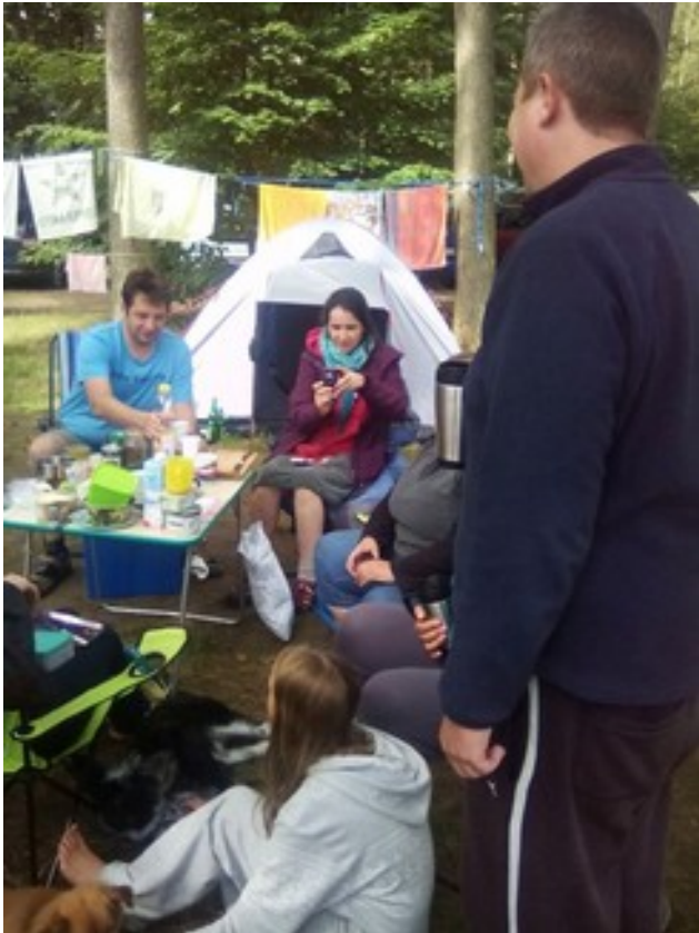
Abbildung 5: Kelkaj SEFTanoj el diversaj federaciaj landoj