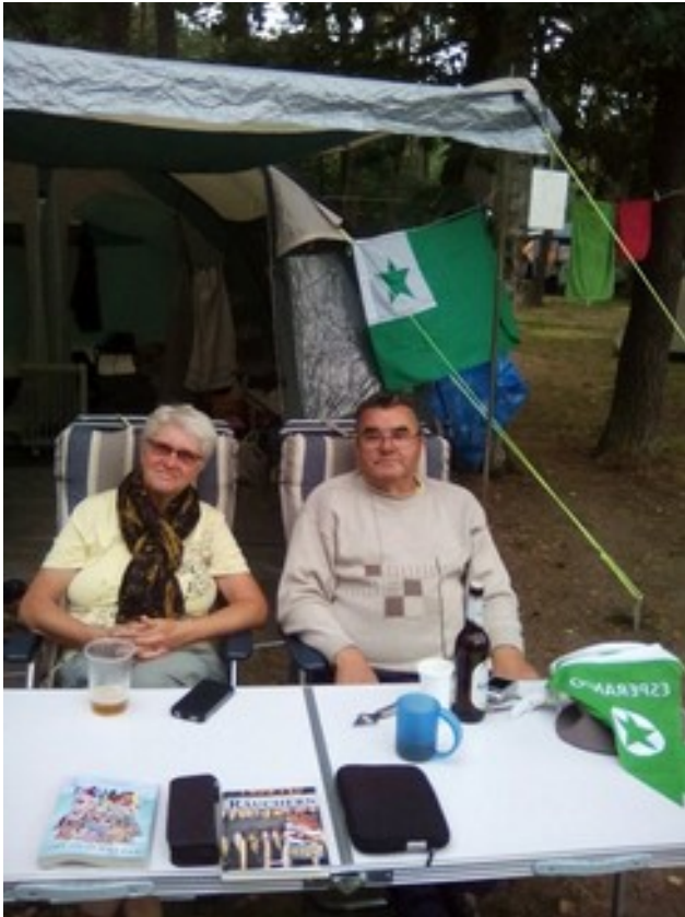
Abbildung 17: Brunjo kaj Vernereto