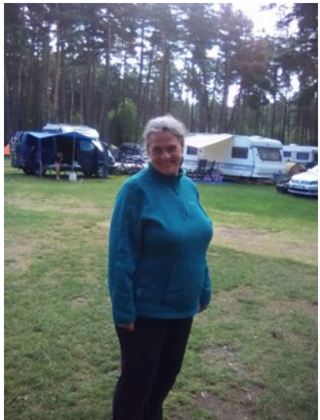
Abbildung 16: Conny ĝuas SEFTon