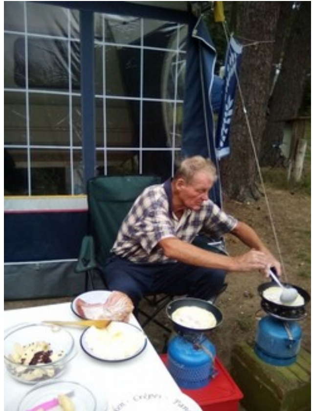
Abbildung 14: Klaas bakas patkukon