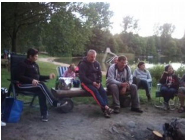
Abbildung 11: Apud bivakfajro