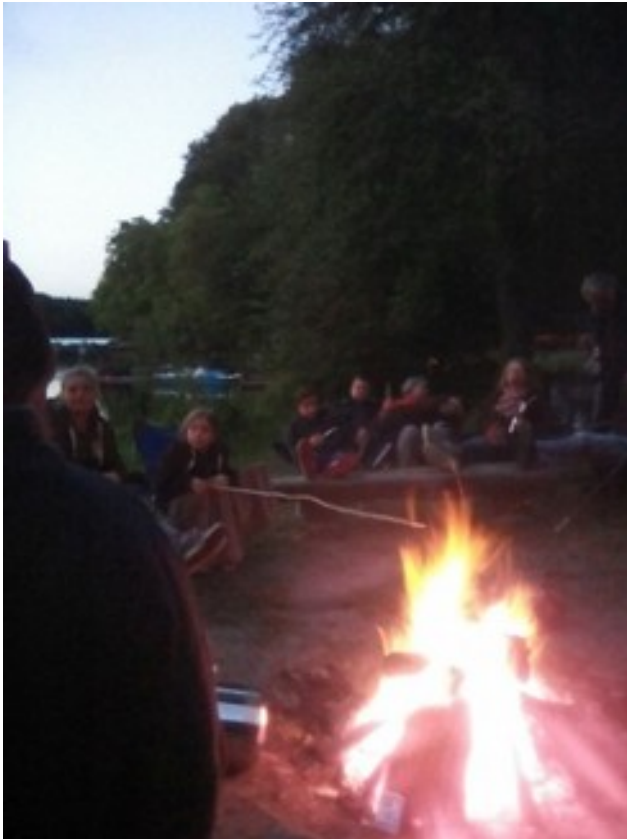
Abbildung 13: La bivakfajro forte brulas