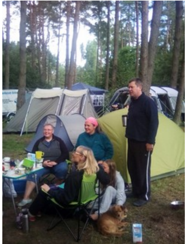
Abbildung 6: Rondeto ĉe Trine