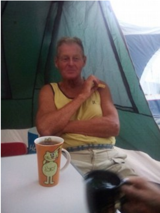
Abbildung 1: Klaas êuas kekson