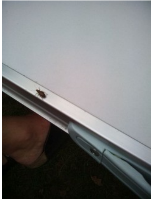
Abbildung 18: Kiu konas ĉi tiun skarabeton?