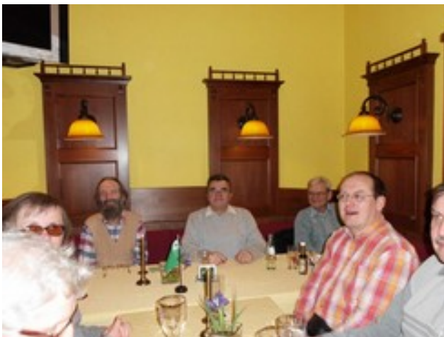
Abbildung 8: Nia rondeto