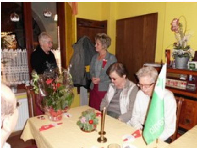
Abbildung 2: 20 Jahre "Uns Eck"

Der "Zufall" wollte es, daß der städtische Weihnachtsmann zu uns kam, wir sangen ein paar alte Lieder und wurden dann reichlich beschenkt.