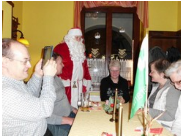
Abbildung 5: Der Weihnachtsmann beim Treffen im Dezember 2015