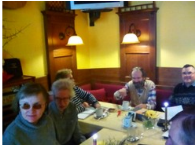
Abbildung 16: La tuta rondo