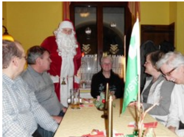
Abbildung 3: Der Weihnachtsmann überraschte uns