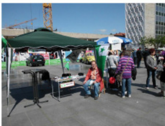
Abbildung 20: René auf dem Infostand