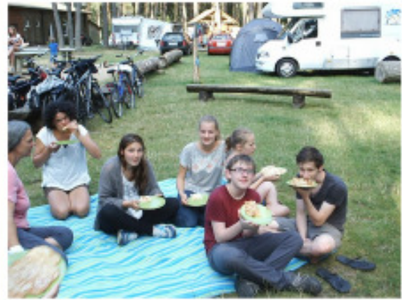
Abbildung 5: Der Eierkuchen ist ja lecker.