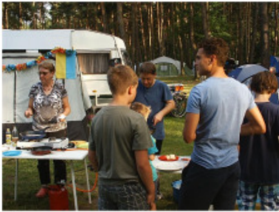
Abbildung 4: SEFT-Teilnehmer stehen nach Eierkuchen an