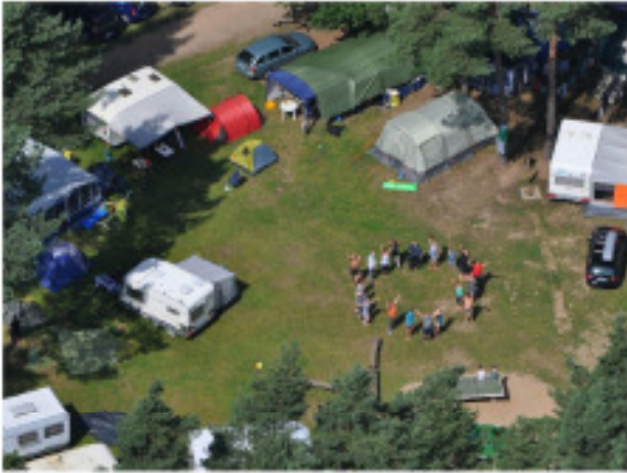
Abbildung 1: das Zentrum des SEFT mit einigen unserer Zelte und eine Gruppe von Freunden. Foto: Nils A.)

Besuch des SEFT per Flugzeug, Nils A. kam mit seinem Motorgleiter vom Flugplatz Parchim und begrüßte die SEFT-Freunde mit einigen Ehrenrunden.