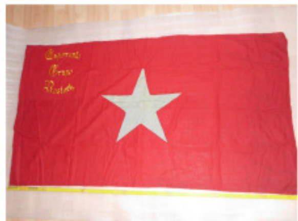
Abbildung 7: Arbeiter-Esperanto-Fahne Rostock von 1928.

Auch eine wiederentdeckte Fahne wurde dort übergeben.