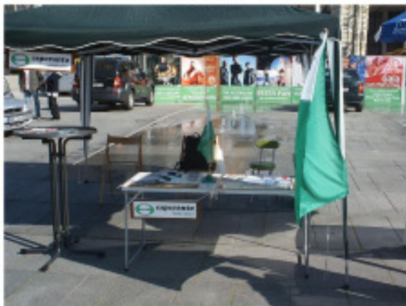
Abbildung 18: Unser Infostand bevor es losging

Am 1. Mai 2014 hatten wir einen Infostand aufgebaut, wo wir zahlreiche Interessenten über Esperanto informieren konnten und viele Faltblätter verteilt haben.