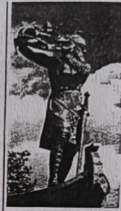
Worms: (Hagen versenkt den Nibelungenschatz. Standbild, 1905 von Johann Hirt geschaffen, steht seit 1932 am Rhein)